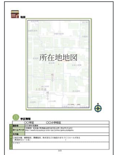
建物所在地の地図と学区情報を記載します。