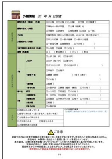
京町家に残されている外観情報を記載します。