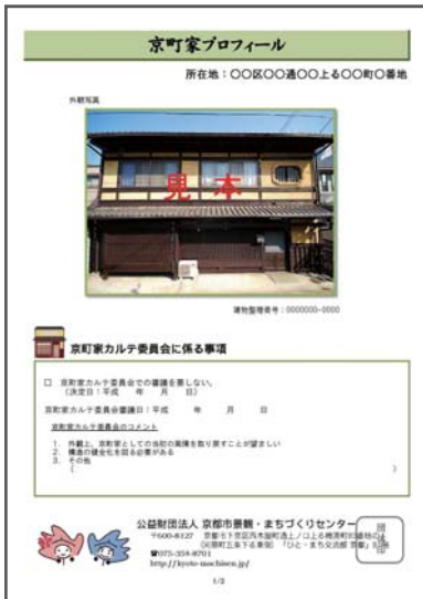
京町家の外観写真と委員会に係る事項を記載します。