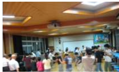
21日の練習会にて。ランチルームで保存会会員の方に教えていただきました。