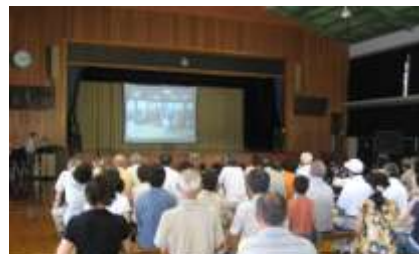
講習会では、踊りの文化や踊り方などについて話していただきました。