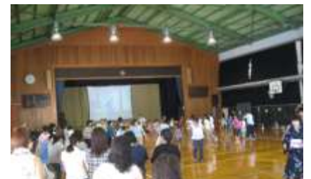
講習会にて。男性、女性、子どもに分かれて練習しました。