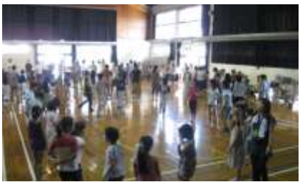
保護者や地域の方と一緒に、子どもたちも多く参加してくれました。