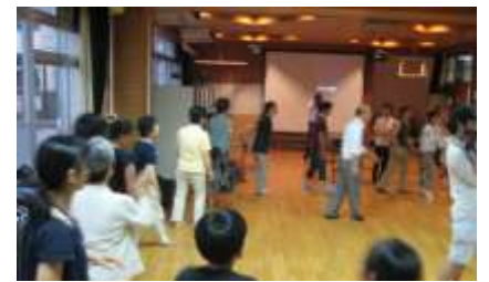
17日の講習会に引き続き2回目となり、少しずつ踊り方がわかってきました。