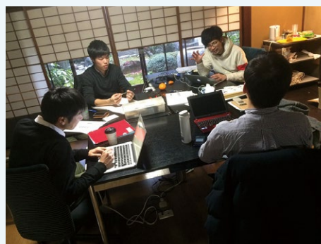
大型の京町家をシェアオフィス(共同の事務所)や貸会場として活用