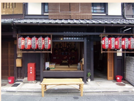
京都らしい賃貸住宅として活用