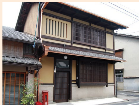
一棟貸しの宿泊施設として活用