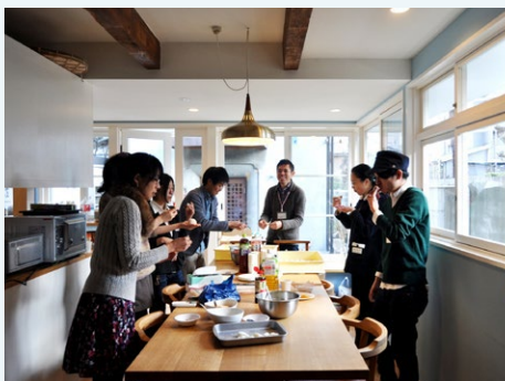
複数の借り手が共同利用する賃貸住宅として活用