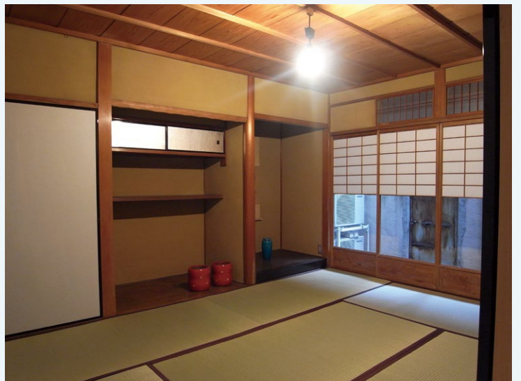
再生後の外観と内部