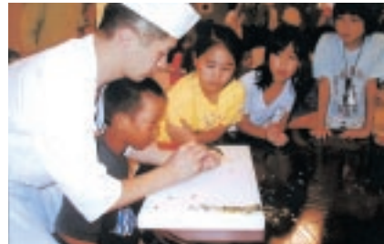
総合学習で京料理を体験する子どもたち

に触れる、そして、本物を体験する、これらのことを通じて、児童は、それぞれに「京都らしさ」を見つけ、「京都の魅力」を感じています。