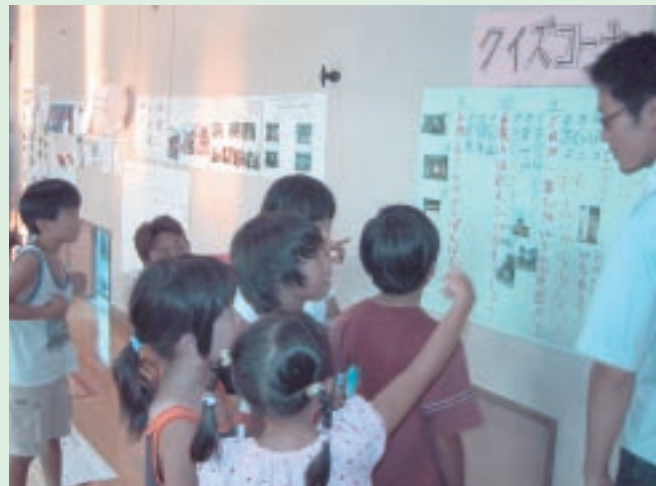
夏まつりで設けた子ども向けクイズコーナー

まず、最初に取り組んだのは、メンバーの思いや活動内容を広く学区の方々にお知らせすることでした。そこで、学区民の方々が大勢集まる8月の「夏まつり(貞教PTA主催)」に参加し、アピールしようということになりました。子ども向けには、貞教学区に関するクイズを、また、大人向けには、「貞教探・見・隊」をPRするリーフレットの配布を行い、その結果、地域への愛着を深める、また、メンバーの思いを知らせる機会となりました。