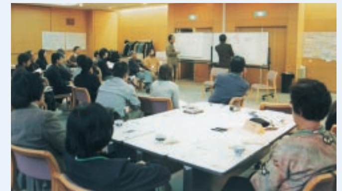
グループワークの後、全員で意見交換、共有を行いました

期間中、約200名の方が足を運ばれ、「これほどたくさんの方が足を運ぶとは驚いた」、「どの取組も『オンラインワン』だと感じた」等、活発な京都のまちづくり活動に刺激を受けておられたようです。