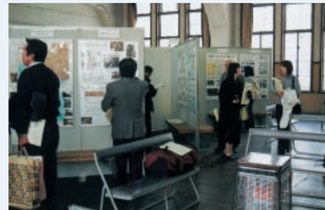
パネル展示の様子

日程：平成14年11月14日(木)～18日(月) 場所：元京都市立龍池小学校 2階講堂