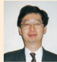
京都市都市計画局長 海堀安喜