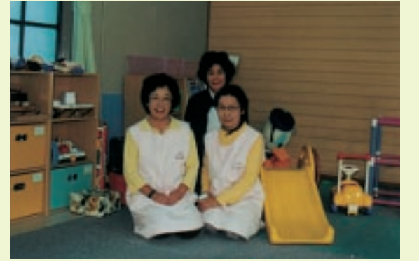
私たちがお預かりします

社団法人京都市シルバー人材センターによる子どもの一時預かり施設「ばあばサービスピノキオ」をご紹介します。子育てで大変な思いをしている方々の心強い味方の登場です。