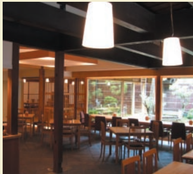
店内入口から光あふれる庭を眺める

何かに追われる焦燥感から逃れ、自分に心地よい時間、自分のための「とき」を過ごす。ここには穏やかな時間が流れている。