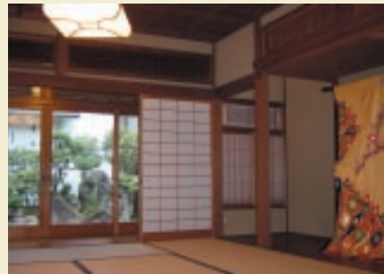
展示会場にもなる座敷

たな事業を始める。創始者の気持ちを再確認する意味でも、社員全員が創業者となり、一丸となつて作りあげていく。店名やロゴマークもみんなで決めた。いろんなアイデアを出し合い、手探りですすめる。創業50周年を迎える節目の年に「蒼」は生れた。