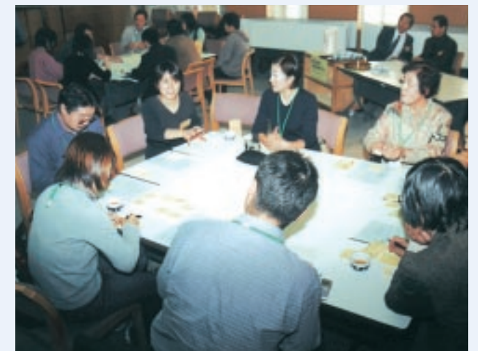
4つのグループに分かれて意見交換をしました

なお、ワークショップの詳細につきましては、センターのホームページでも公開予定です。