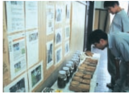
会場には様々な自然の素材が展示されました。

環境に対する問題意識が高まり、環境との調和をめざす持続可能な地域や都市を形成できるかどうか強く問われる中で、自然素材を活用した建築に大きな注目が集まっています。9月7日に行われた景観・まちづくりシンポジウム「自然の建築と手づくり」では、その自然素材の新しい使い方に着目し、身近な素材で自家や住環境を組み立てていく意義やそれを支える仕組みについて考えました。