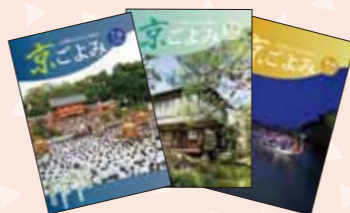
京都市観光協会が毎月発行する 京都観光の先取り情報誌

市観光協会の使命です。今後とも、持続的な京都の魅力創出の一翼を担う気概の下、積極的な事業展開を図っていきたくと考えています。