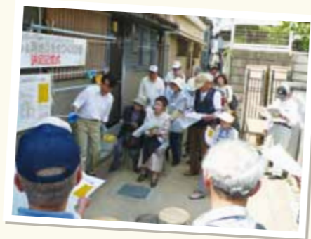
近隣住環境計画を説明中の姿

当財団は多くの専門家の方々のご協力のもと、地域のまちづくりや京町家の保全・再生に関わる事業を行っています。このコーナーでは、豊富な経験や知識、また熱い思いをもって京都のまちに関わっておられる専門家の方を紹介しています。今回は地域まちづくりの専門家です。