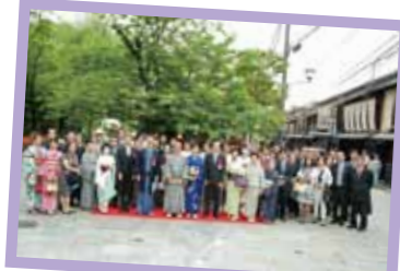
祇園新橋景観づくり協議会認定式の様子

これからも「おたがいさま」の気持ちを大切に、「らしさ」を見失わないまちづくりをしていきたいと願います。