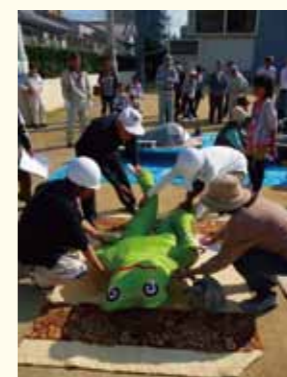
「防災クレンジャー」の様子

毎年行う防災訓練も、若いファミリーに楽しんで参加してもらえるよう、工夫しています。なまずに押しつぶされた手づくりのカエルの人形を助け出す救助訓練「 防災クレンジャー 」や、スタンプラリー、防災劇など、みんなが楽しんで協働体験ができる試みの積み重ねが、地域の絆を深めています。