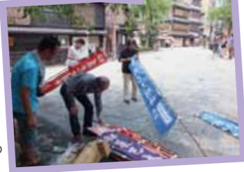
辰巳大明神のお祭り準備

祇園新橋景観づくり協議会に至るまでの活動は『京まち工房』71号に掲載されています。