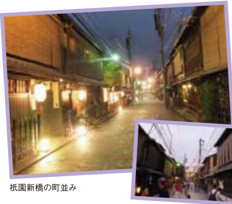
祇園新橋の町並み