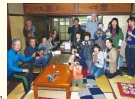
「ほっとせいつつ」での催し

顔の見える関係づくりの取組が空き家の活用にもつながり、活動の広がり一役買っています。