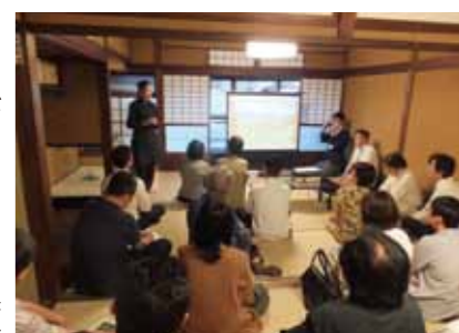
きさこ和東で開かれた京町家専門講座の様子

これからも、この町家からいろいろな人や地域とのつながりを広げていけたらいいな、と思っています。