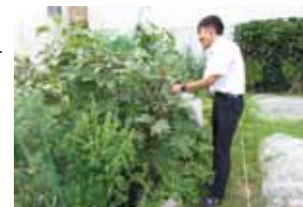
貸農園で野菜を収穫する

最初の年に5組の方が借りてくださったのではずみがつき、町家の改修に踏み切ることができました。