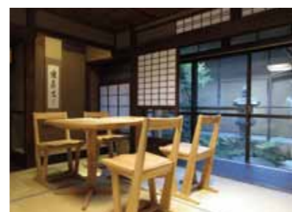
ゆったりくつろげる畳敷のカフェスペース

建物にすっかり愛着を持っていたので、カフェスペースも畳敷や床の間を残すなど、住んでいたときの雰囲気が残るように設計をお願いしました。この先カフェをやめても、また住居として使えるようにしたかったのです。とはいえ、畳敷部分と廊下の段差をなくすなど、見えないところに手を掛けていただいています。