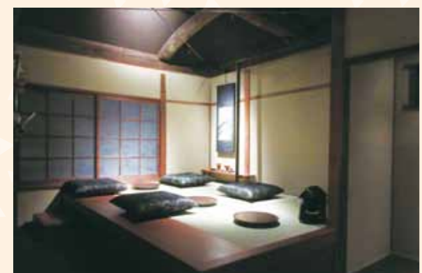
伝統的な空間をいかしたスターバックス京都二寧坂ヤサカ茶屋店の客席

二寧坂の建物の活用に取り組む中で、京都市景観・まちづくりセンター（まちセン）との出会いがありました。ヤサカの得意分野で京町家の保全活動に協力できればと考え、寄附付き「京町家」観光タクシープランを提案させていただきました。京町家などの伝統的な建物と地域のつながりこそが京都のまちの魅力だと実感しています。