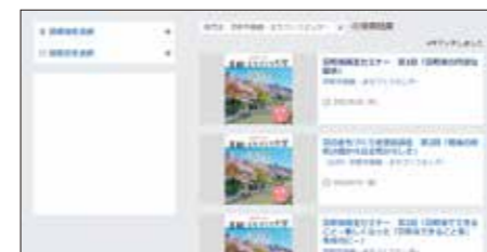
申込受付中の 講座一覧ページ (イメージ)