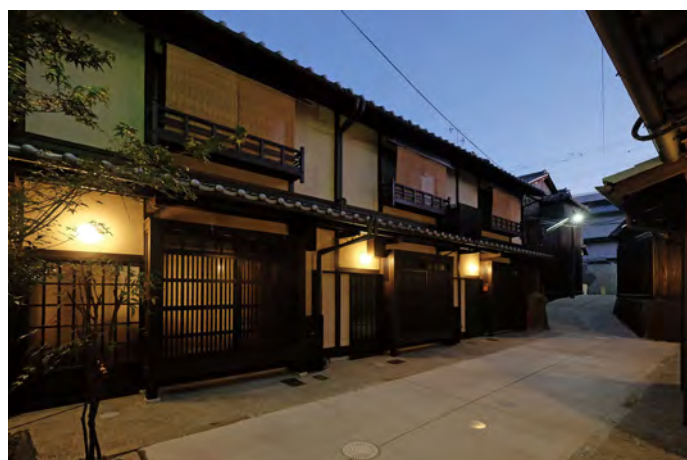
通り景観の修景事例