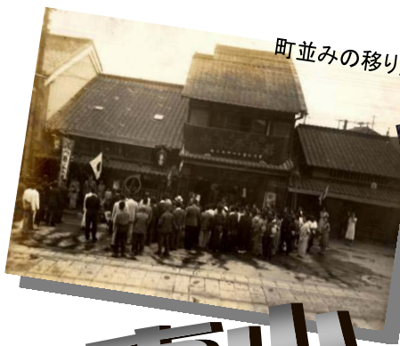
町並みの移り変わり