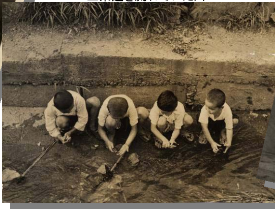
五条通を流れていた川